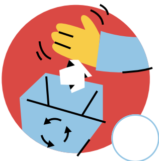
Jette les ordures à la poubelle