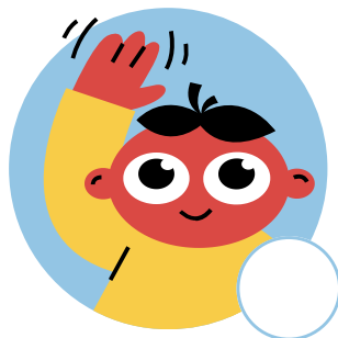
Lève la main pour poser une question