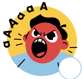
Crie ou parle fort en classe