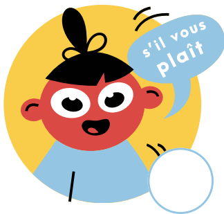
Dit "s'il te plaît"