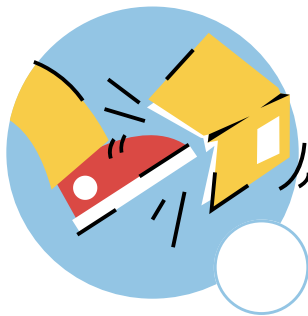
Met le bazar