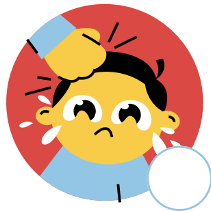
Blesse un camarade