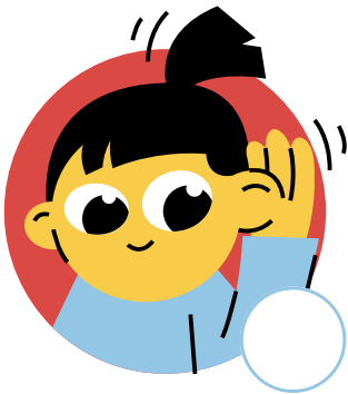
Ecoute en classe

Parmi les enfants suivants, qui suit les règles de la classe? Donne-leur des étoiles pour un travail bien fait.